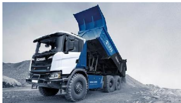
Batteriebetriebener Scania Kipper (lkab)

Auf dem Eisenerzbergwerk Malmberget von LKAB werden zwei batteriebetriebene LKW von Scania im untertägigen Einsatz getestet. Der eine ist ein Muldenkipper mit einem Gesamtgewicht von 49 t, der andere ein LKW mit Kranaufbau. Dieser soll Bohrstaub zu den untertägigen Bohranlagen liefern.