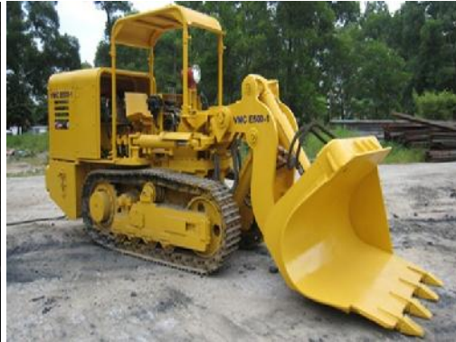
Lader VMC E-500-1 (tkv)

Wegen Arbeitskräftemangel und steigender Kosten hat die Vinacomin Schwierigkeiten die Kohlekraftwerke mit ausreichend Kohle zu beliefern. Vom 01. Januar bis 14. März wurden mit 6,3 Mio. t 31% weniger geliefert als geplant. Hauptgrund ist die Erkrankung der Hälfte der Bergleute an Covid-19 und auf einigen Bergwerken sind Ende Februar nur 20% der Leute wieder angefahren. Zum anderen sind bisher nur 7% der geplanten Importkohle angeliefert worden.