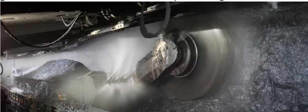
Streb auf Moranbah North (amm)

Ein 59-jähriger Bergmann des Bergbaudienstleisters Mastermyne wurde auf dem australischen Koks-Kohlebergwerk Moranbah North von Anglo American beim Transport von geraubtem Schildausbau getötet. Er hatte bei dem Unfall schwere Kopfverletzungen erlitten.