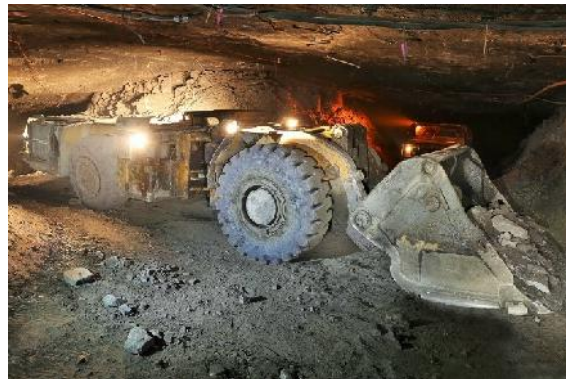
LHD auf einem Bergwerk der KGHM

Der Kupferproduzent KGHM hat 2021 mit einem Gewinn von 1,304 Mrd. Euro abgeschlossen. Die Kupferproduktion stieg um 44.600 t (+6%).