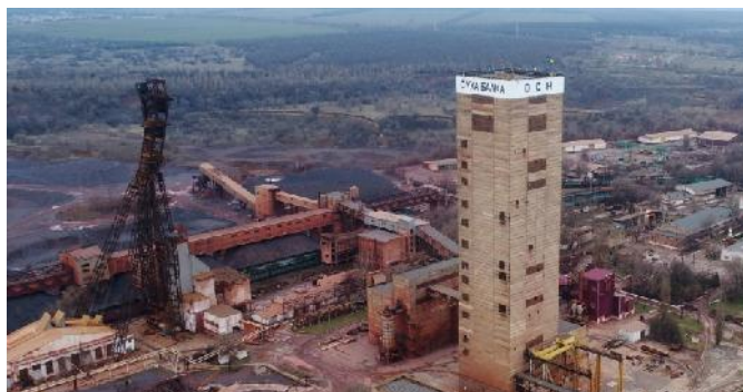
Sucha Balka (DSN)

Die Eisenerzbergwerke von Sucha Balka der DSN Steel stehen weiter unter Kriegsrecht. Es wird auf zwei Schichten gearbeitet – von 8:00 bis 18:00 Uhr und von 18:00 bis 8:00.