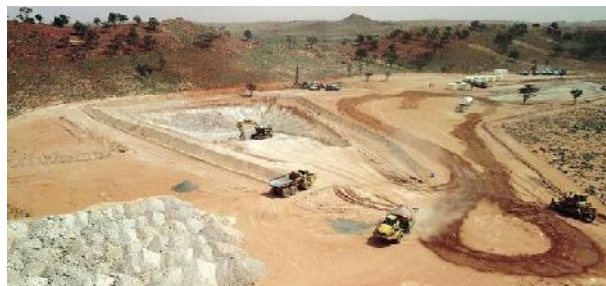
Voreinschnitt für die Schrägschächte (proactive)

Cobalt Blue hat mit dem Bau des Bergwerks in Pyrite Hill begonnen. Die Kobalt-Pyrit-Lagerstätte wird über zwei Schrägschächte mit 80 m Länge erschlossen.