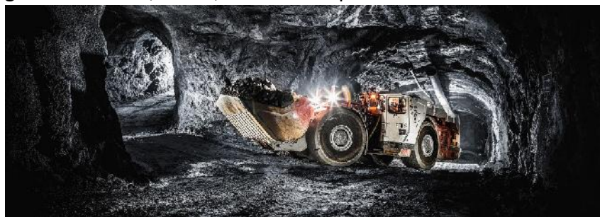
Bergwerk Venetia (geodrilling)

De Beers hat die erste Stufe der Wasserhaltung für das neue Diamantenbergwerk Venetia fertiggestellt. Da das Bergwerk unter dem Tagebau liegt und in Gefahr ist bei Starkregen überflutet zu werden, kann die Wasserhaltung durch Tore vor eindringendem Wasser abgeriegelt werden. Die Tore sind 8 m hoch, 7 m breit und 1 m dick. Die Wasserhaltung kann bis zu 360 m 3 /h aus einer Teufe von 540 m bis zur 120 m Strosse im Tagebau heben. Von dort aus wird das Wasser über zwei 120 m lange Rohrleitungen bis zur Oberfläche gehoben. Im 3. Quartal 2023 soll dann die Hauptwasserhaltung auf der Sohle 56 fertig sein. Dann können von dort aus insgesamt bis zu 4.500 m 3 /h gehoben werden. Bei voller Auslastung sollen jährlich 6 Mio. t Rohgestein gefördert und 4,5 bis 5,5 Mio. Karat produziert werden.