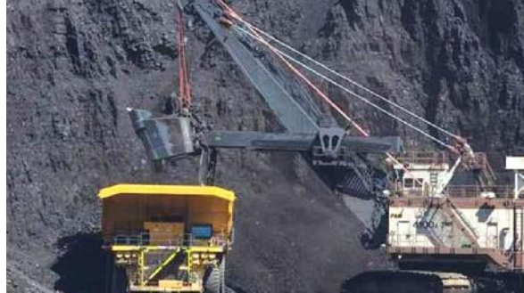
Tagebau Lubu (contango)

Die britische Contango Holdings will am 31. März die erste Kohle aus dem Kokskohletagebau Lubu fördern. Die Aufbereitung ist in Anlieferung und soll im 2. Quartal montiert werden. Geplant ist außerdem der Bau einer Kokerei.