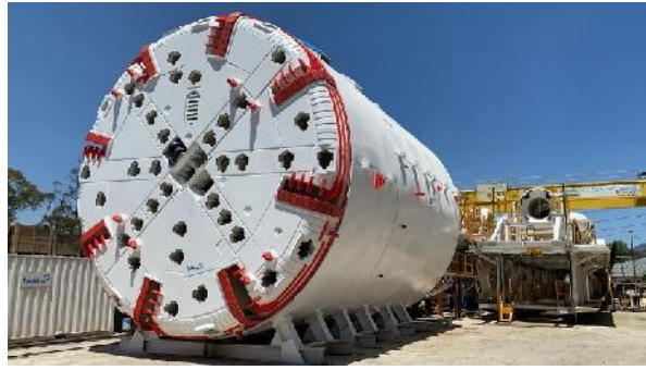
Robbins TBM (tunnel business)