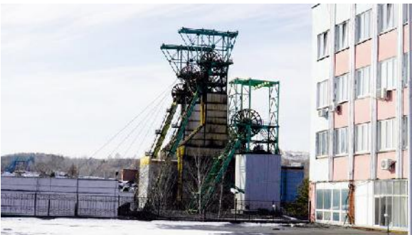
Bergwerk Osinnikowskaja (ruk)

Auf dem russischen Kohlebergwerk Osinnikowskaja von Jushkuzbassugol (RUK) wurde ein Bergmann bei einem Kohle-Methan-Ausbruch im Streckenvortrieb 5 getötet.