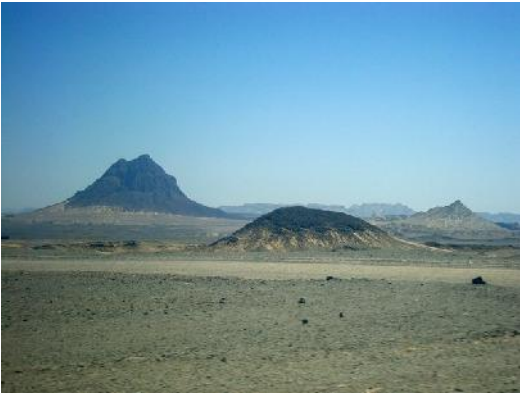
Das Gebiet der Lagerstätte Reko Diq (barrick)