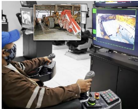
Steuerstand für die hydraulischen Gesteinsbrecher (freeport)

Freeport Indonesia setzt in der Deep Mill Level Zone auf seinem Gold- und Kupferbergwerk Grasberg in West-Papua autonome Gesteinsbrecher mit der Technologie von Remote Control Technologies ein.