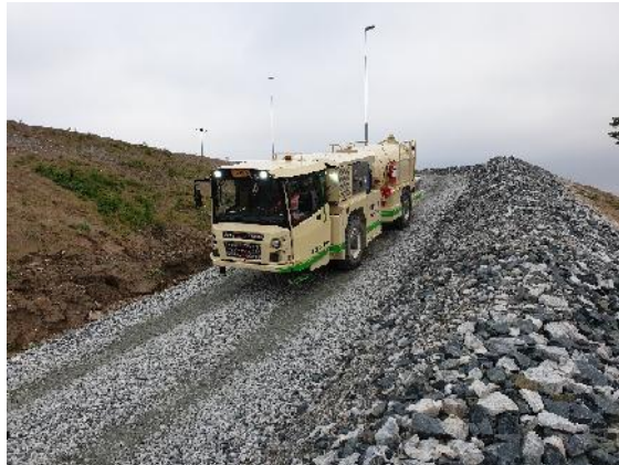
Utimec MF 500 SD (normet)

Auf dem Goldbergwerk Efemçukuru von Eldorado Gold beginnt Ende April der Test mit einem batteriebetriebenen Betonmischerfahrzeug Transmixer Normet Utimec MF 500 SD. Der Test erfolgt über einen mit einer 15% Steigung Schrägschacht in das söhlige Streckennetz des Bergwerks. Die Mischtrommel fasst 4,4 m 3 Beton und kann stufenlos auf eine Drehzahl von 0-13 U/min geregelt werden. Das Fahrzeug hat eine Nennleistung von 200 kW.