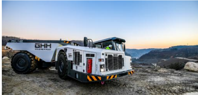
MK-42 im Steinbruch