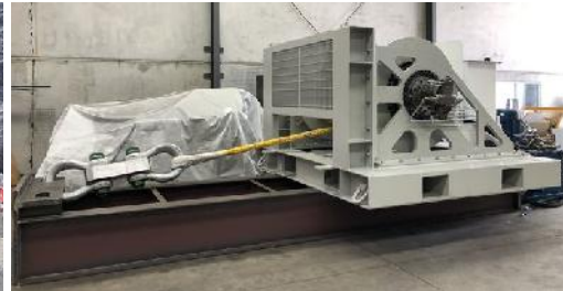
Bergwerk Broadmeadow 100 t – Winde

Whitehaven will durch den Erwerb der Bergbaulizenz Narrabri South die Lebensdauer des Streibergwerks Narrabri um 14 Jahre verlängern. Damit können über die vorhandene Infrastruktur weitere 80 bis 100 Mio. t Kohle gefördert werden.