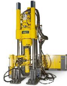
Raiseboring Kopf und 73RH

In Jakutien graben Bergleute illegal bis zu 60 m lange Tunnel in die Uferböschung des Jakutia um prähistorische Tiere zu bergen. Alles gefundene wird zu horrenden Preisen auf dem asiatischen Markt verkauft. Die selten kontrollierende Polizei bestraft die Arbeiten mit höchstens 41,00 Euro.