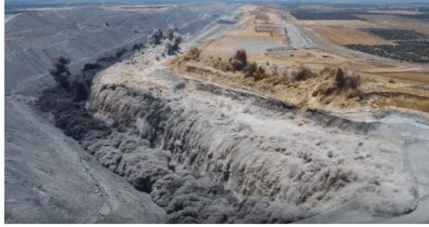
Sprengung im Tagebau Caval Ridge