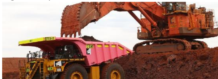
Tagebau Roy Hill

EPIROC hat zusammen mit Autonomous Solutions Inc. Mining einen Vertrag zur Umrüstung auf den autonomen Einsatz der 77 Kipper auf dem Eisenerz-tagebau Roy Hill unterzeichnet.