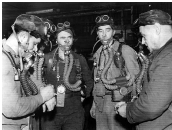
Grubenwehrtrupp der VEB Bleierzgrube Albert Funk am 24.2.1960

Am 22. Februar 1960, vor 60 Jahren wurden beim schwersten Grubenunglück in der DDR 123 Bergleute getötet. Der Auslöser für die Schlagwetter- und Kohlenstaubexplosion in einer Teufe von 950 m auf dem VEB Steinkohlenbergwerk Karl Marx in Zwickau war wahrscheinlich „unsachgemäßer Umgang mit Sprengstoff“. Die Stasi veröffentlichte zuerst als mögliche Ursache erhöhte Methanaustritte nach einem Erdbeben in Marokko. Auch hielt sich lange das Gerücht, dass ein gehörnter Ehemann als Schießmeister mit seinem Selbstmord die Katastrophe ausgelöst hatte. 460 Grubenwehrmänner waren tagelang im Einsatz. Ein Grubenfeld musste wegen des nicht löschraren Brandes abgedämmt und konnte erst nach einem Jahr wieder geöffnet werden. 17 Bergleute blieben für immer unter Tage.