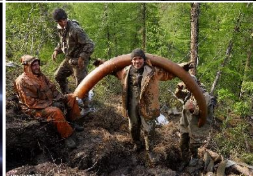
„Bergbau auf Urzeittiere“