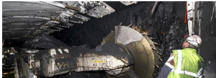
Streb auf dem Bergwerk Narrabri

EPIROC hat zusammen mit Autonomous Solutions Inc. Mining einen Vertrag zur Umrüstung auf den autonomen Einsatz der 77 Kipper auf dem Eisenerz-tagebau Roy Hill unterzeichnet.