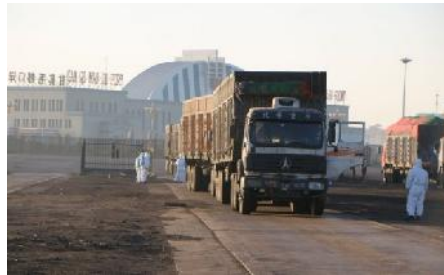
Grenzübergang Gashuun Sukhait

Das Land hat bis auf zwei Grenzübergänge alle anderen Grenzübergänge nach China geschlossen um die Ausbreitung des Coronavirus zu verhindern. Damit ist der Kohlenexport um 90% zurückgegangen. Die Sperre gilt bis 2. März.