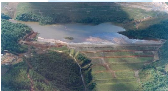
Absetzteich Sul Superior

Vale hat an der Nordböschung des 2016 stillgelegten Eisenerztagebaus Gongo Soco Bewegungen festgestellt. Diese könnten den Absetzteich Sul Superior in 1,5 km Entfernung gefährden und zum Bruch führen. Die brasilianischen Behörden wurden informiert und die Dörfer im Umland gewarnt.