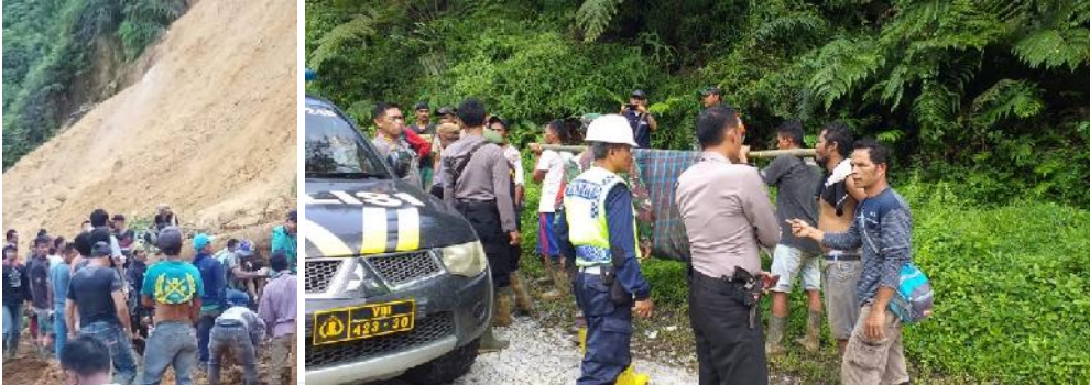
Erdbeben am Berg Pongkor

Bei einem Erdbeben nach heftigen Regenfällen wurde ein Goldgewinnungsbetrieb am Fuß des Berges Pongkor in der indonesischen Provinz West Java verschüttet. Man vermutet mehrere Dutzend Bergleute unter den Schlammmassen. Bisher wurde fünf Bergleute tot geborgen.