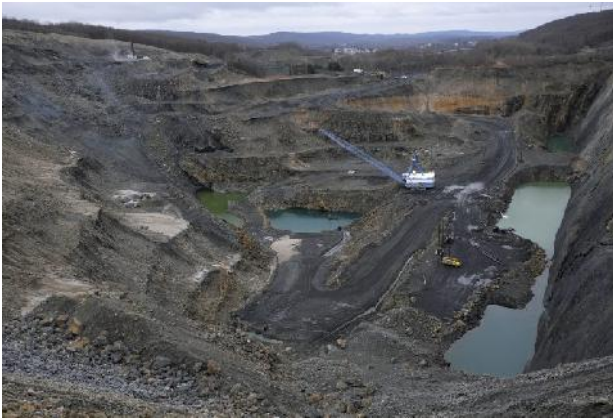
Anthrazittagebau von Blaschak Coal

Cloud Peak Energy, der drittgrößte Kohleförderer des Landes hat Insolvenz angemeldet. 2018 wurden 59 Mio. t Kohle gefördert und verkauft. Das Unternehmen betreibt die Tagebaue Antelope und Cordero Rojo in Wyoming und den Tagebau Spring Creek in Montana.