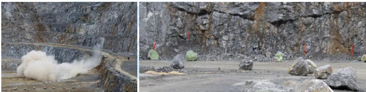
Steinbruch Rhodenhaus-Nord Zwischen den Markierungen sind die Stollenportale

Die Lhoist GmbH – Rheinkalk GmbH blickt auf ein erfolgreiches Jahr 2018 zurück. Es wurden 30 Mio. Euro Netto erwirtschaftet. In das Werk Flandersbach wurden 54 Mio. Euro investiert in die Instandhaltung der Anlagentechnik, die Lagerstätten erkundung und den Umweltschutz. Grundpfeiler der Rohstoffsicherung ist der Steinbruch Silberberg. Seine Erweiterung ist genehmigt und die Vorbereitungsarbeiten laufen. Im Tagebau Rohdenhaus-Nord sollen in den nächsten 18 Jahren bis zu einer Teufe von 170 m rund 170 Mio. t Kalk abgebaut werden. Ab 2020 soll hier der Kalk versuchsweise untertägig abgebaut werden.