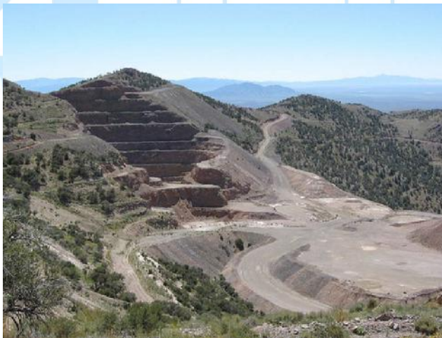
Tagebau Gold Bar

Im Goldtagebau Gold Bar von McEwens in Nevada wurde ein Bergmann getötet. Sein Lkw kam von der Tagebaustrasse ab und überschlug sich.