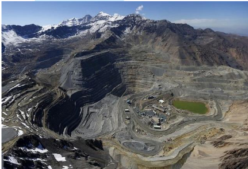
Tagebau und Bergwerk Andina

Bei Wartungsarbeiten wurde ein Bergmann auf dem Bergwerk Andina der Codelco / Chile getötet. Das Bergwerk wird aktuell von der tiefsten Sohle des Tagebaus entwickelt.