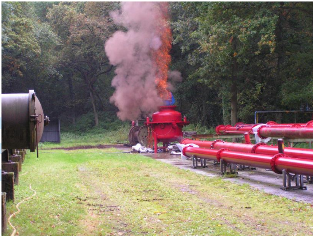
Berggewerkschaftliche Versuchstrecke in Dortmund Derne