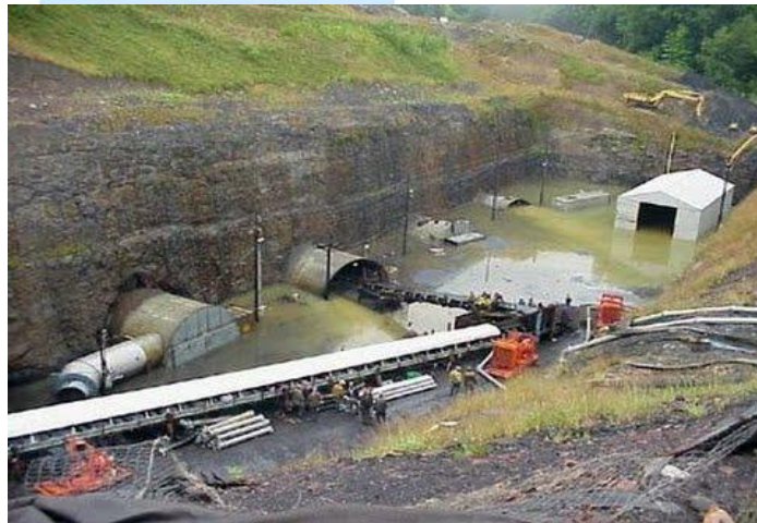
Bergwerk Quecreek nach der Überflutung am 24.07.2002

Corsa Coal plant für 2017 eine Förderung von 1.475 Mio.t Kokscohle und 725.000t Kraftwerkscohle. In Pennsylvania betreibt das Unternehmen die beiden Bergwerke Casselman und Quecreek. Anfang 2017 nimmt dann noch das Bergwerk Acosta die Förderung auf. In Tennessee sind neben den Bergwerken Cumberland Gap, Cooper Rigde, Straight Creek und Ben`s Branch die Tagebaue Straight Creek Surface und Double Mountain in Förderung.