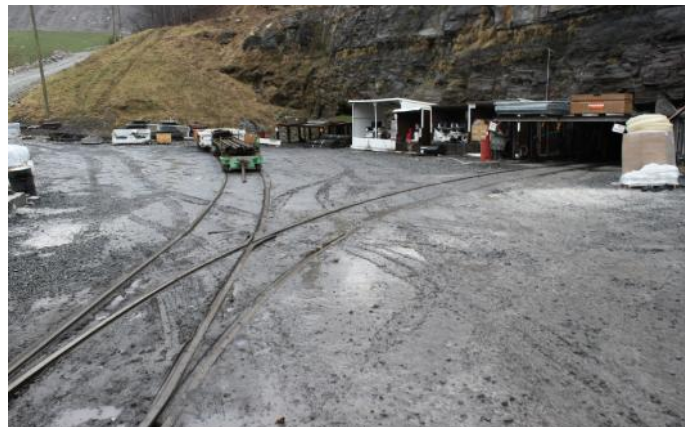
Bergwerk Maple Springs

Für 2017 ist der Förderbeginn von vier neuen Kokscohlebergwerken in Pennsylvania geplant. Coal Resources nimmt das Bergwerk Polaris in Förderung. Die Tochtergesellschaft LCT Energy der Robindale Energy will im Juni das Bergwerk Maple Springs mit einer Jahresförderung von 500.000t in Förderung bringen. Corsa Coal nimmt die Förderung des Bergwerks Acosta mit einer Jahresförderung von 375.000t im zweiten Quartal auf. Rosebud Mining baut derzeit das Bergwerk Cresson.