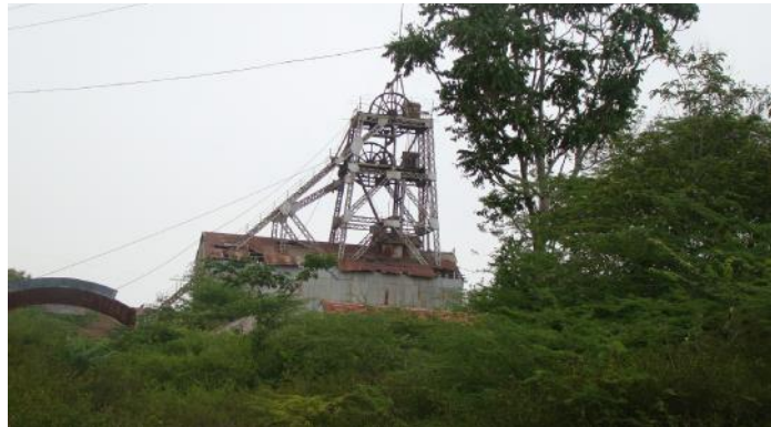
Stillgelegtes Bergwerk - Kolar Gold Field