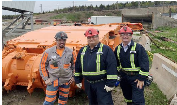
Der erste Continuous Miner von JOY Global

Nach mehreren Verzögerungen im Jahr 2016 will das Bergwerk Donkin der Cline-Group Ende Januar mit der Förderung beginnen. Die Förderung soll bis Ende 2017 / Anfang 2018 auf 2.75 Mio.t gesteigert werden.