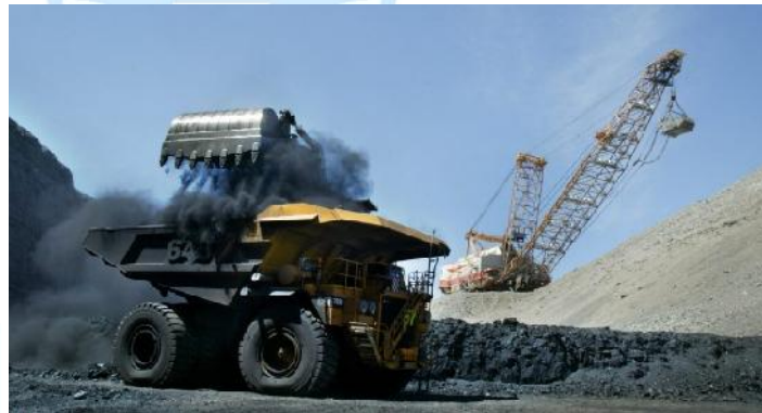
Tagebau der Yancoal

Rio Tinto will seine Tochtergesellschaft für die Förderung von Kraftwerkskohle, die Coal & Allied an die Yancoal Australia für 2,45 Mrd. USD verkaufen. Damit erreicht die Jahresrohfördermenge von Yancoal 71 Mio.t.