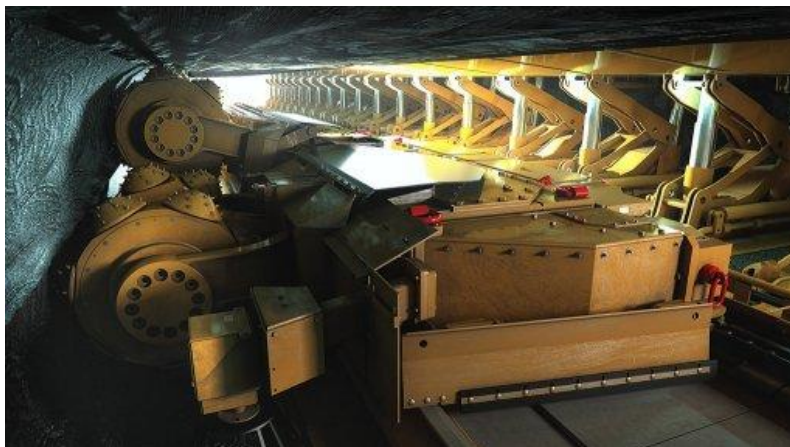
CAT Straight System

Caterpillar startet den Verkauf seines Hardrock Strebsystems „CAT Straight System“. Es ist einsetzbar bei Mächtigkeiten von 1,3m bis 2,0m und Gesteinsfestigkeiten von bis zu 150 MPa. Das System besteht aus dem Gewinnungsgerät HRM220 mit Hinterschneidtechnologie, dem Einkettenförderer HRC30 mit einer Förderleistung von 160t/h und dem Schildausbau HRS1220 mit einem Verstellbereich von 1.060mm bis 2.155mm. Gesteuert wird das System vom PMC-R Automatisierungssystem.