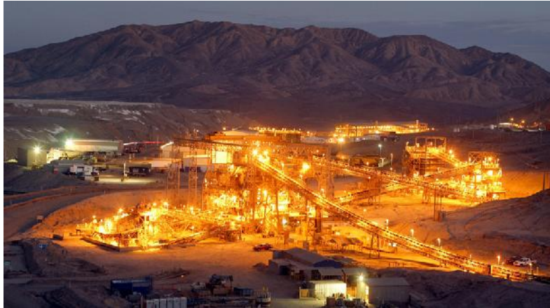
Kupfertagebau Lomas Bayas

Glencore wird seinen Kupfertagebau Lomas Bayas in der Atacama Wüste nicht verkaufen. Kein potentieller Käufer war bereit, die angestrebten 500 Mio. USD zu zahlen.