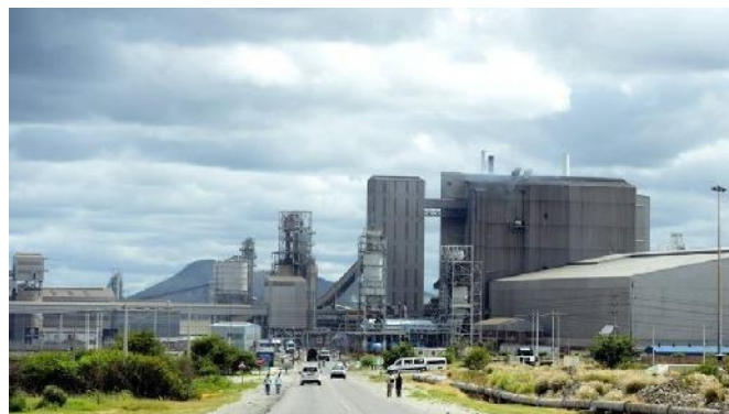
Platinbergwerk Rustenburg East

Auf dem Bergwerk Rustenburg East der Anglo American Platinum in Südafrika wurde ein Bergmann durch Steinfall tödlich verletzt.