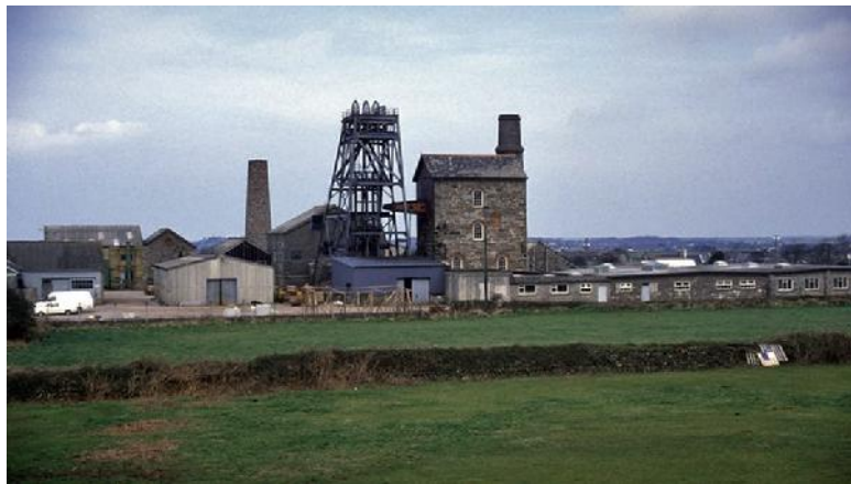
Zinnbergwerk South Crofty

Im September will die kanadische Strongbow Exploration Inc. mit dem Sumpfen des stillgelegten Zinnbergwerks South Crofty in Cornwall beginnen. Danach sollen vier Schächte wieder in Betrieb genommen und die untertägige Infrastruktur in 400m Teufe förderfertig gemacht werden. Eine Förderaufnahme in 2018 ist denkbar.