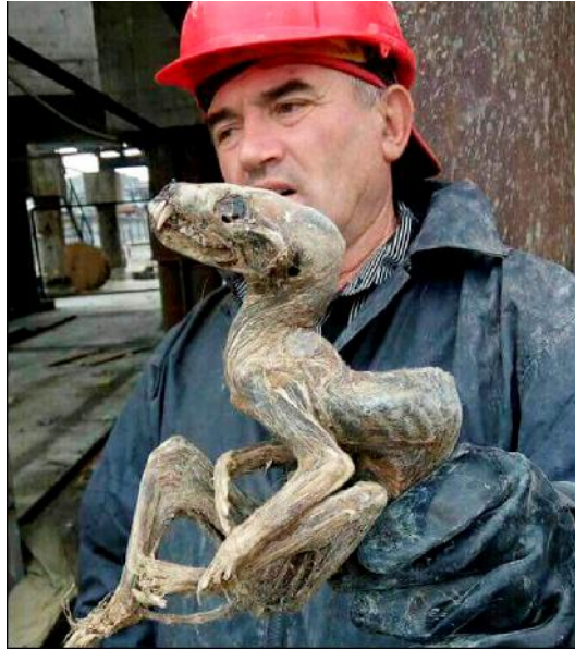
Saurier – Vielfraß (Baummarder) – kleiner Bär – Marder – Zobel?