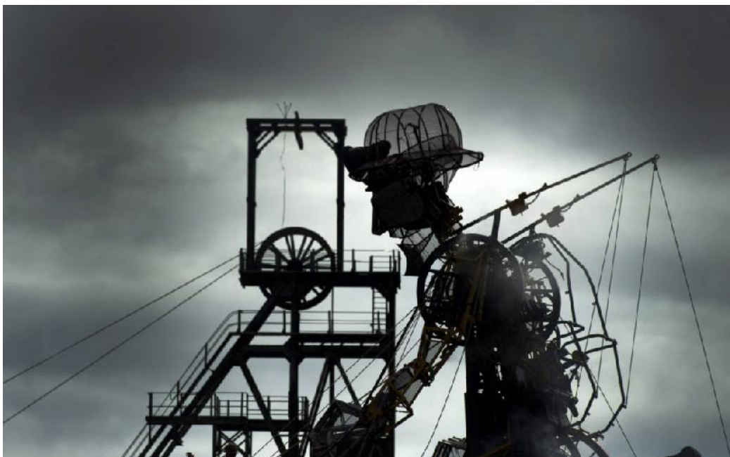
The Cornish Mining Man Engine vor dem Zinnbergwerk Geevor

Nach zwei Wochen und 210km durch die Cornwall and West Devon Mining Landscape World Heritage Site hat die Cornish Mining Man Engine ihr Ziel, das ehemalige Zinnbergwerk Geevor erreicht. 150.000 Menschen bestaunten und feierten mit ihm an den 20 Stopps. Mehrere Millionen Menschen begleiteten ihn live im Internet.