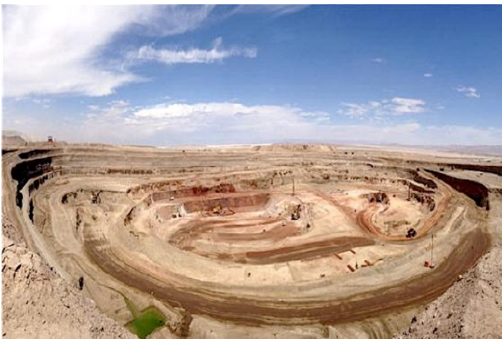
Tagebau Ministro Hales / Codelco

Es wird erwartet, dass in den nächsten zehn Jahren 64 Mrd. USD in den Bergbau investiert werden. Die staatliche Codelco wird daran zu 47% beteiligt sein. Auch die direkten Investitionen ausländischer Firmen sollen von 23 Mrd. USD in 2014 auf 28 Mrd. USD in 2017 steigen.