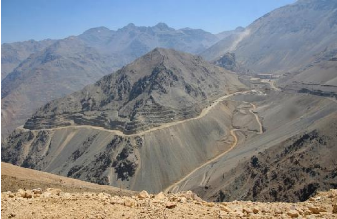
Tagebau Rajo Sur